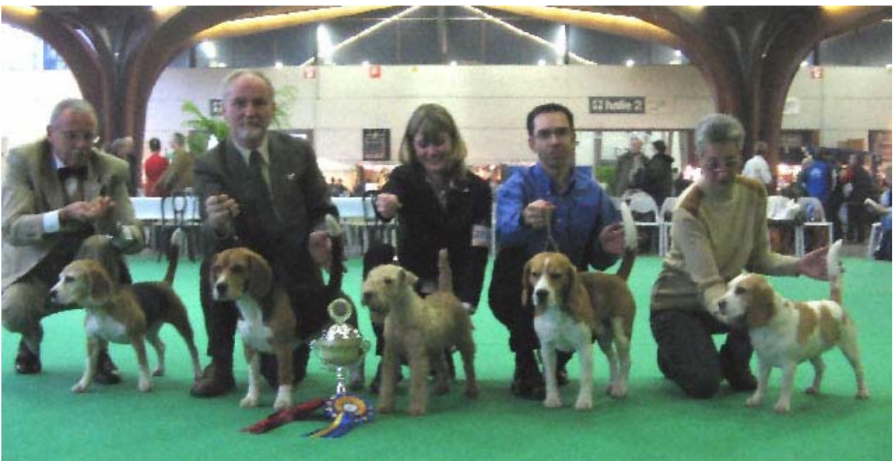
Kortrijk Belgien 2005 - Showhandling - Deutsche Nationalmannschaft - Isabell - erster Beagle von links